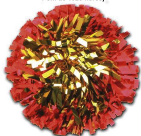
COEUR (Modèle présenté) Largeur de fibre :1.30cm Pom de 1536 fibres)