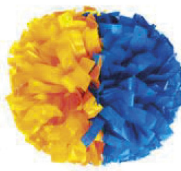
Largeur de fibre 2.54 cm

Plus la fibre est large, moins il y a de fibres dans le pompom. (768 fibres avec une largeur de 2.54cm, 1026 avec une largeur 1.90cm et 1536 avec une largeur 1.27 cm)