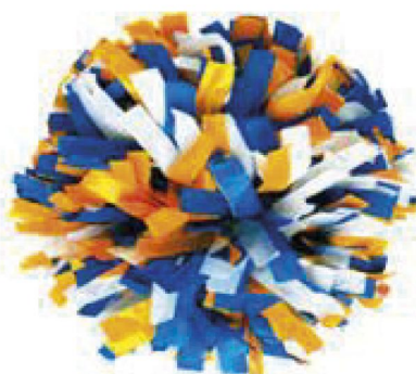
Largeur de fibre 1.90 cm