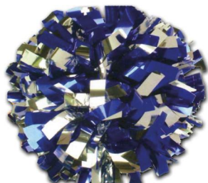
BICOLORE MELANGE (Modèle présenté) Largeur de fibre :2.50cm Pom de 768 fibres)