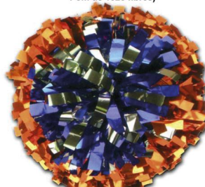
TRICOLORE 1 Couleur Externe et 2 Couleurs mélangées au centre (Modèle présenté Largeur de fibre :1.90cm Pom de 1025 fibres)