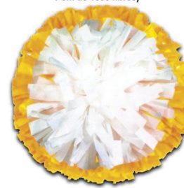
COEUR (Modèle présenté) Largeur de fibre :1.90cm Pom de 1025 fibres)