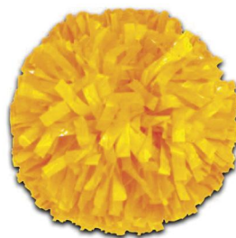
UNICOLORE (Modèle présenté) Largeur de fibre :1.90cm Pom de 1025 fibres)