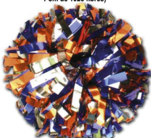
TRICOLORE MELANGE (Modèle présenté) Largeur de fibre :1.90cm Pom de 1025 fibres)