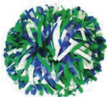
Largeur de fibre 1.27 cm

Ci dessous, trois photos à échelle identique vous permettant de vous faire une idée des différentes largeurs. (vous pouvez, d'ailleurs, avoir une idée « grandeur nature » en découpant chez vous une feuille de papier.)