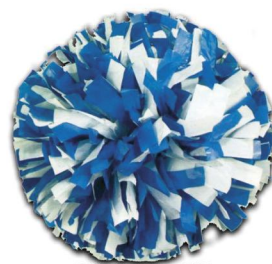
BICOLORE MELANGE (Modèle présenté) Largeur de fibre :2.50cm Pom de 768 fibres)