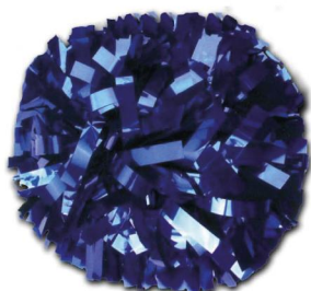
UNICOLORE (Modèle présenté) Largeur de fibre :1.90cm Pom de 1025 fibres)