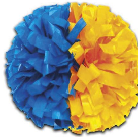
MOITIE MOITIE (Modèle présenté) Largeur de fibre :2.50cm Pom de 768 fibres)