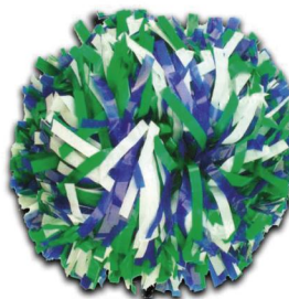
TRICOLORE MELANGE (Modèle présenté) Largeur de fibre :1.30cm Pom de 1536 fibres)