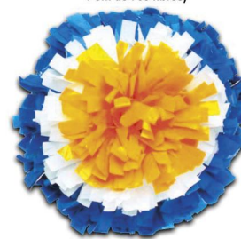
COCARDE (Modèle présenté) Largeur de fibre :1.900cm Pom de 1025 fibres)