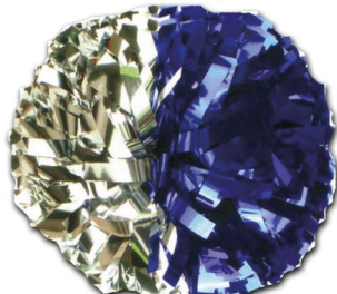
MOITIE MOITIE (Modèle présenté) Largeur de fibre : 1.90cm Pom de 1025 fibres)