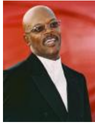
Samuel L. Jackson