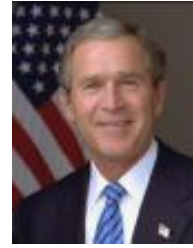
George W. Bush